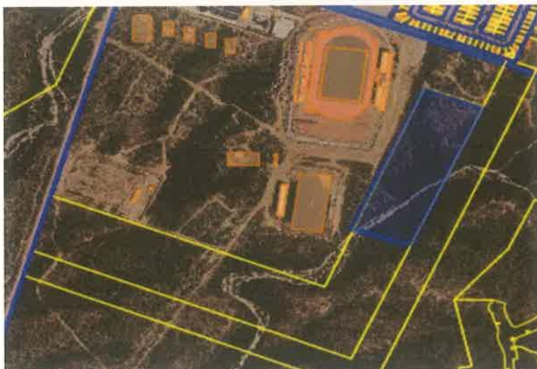
Fracción de 30,000.00 m2 de la Fracción B-C de la fracción B remanente de la fracción B, dentro del predio denominado "La Laguna", en Col. Los Cangrejos, en Cabo San Lucas, B.C.S.

(treinta mil metros cuadrados) para que sea donada a favor del Instituto Tecnológico de Estudios Superiores de Los Cabos, en B.C.S.