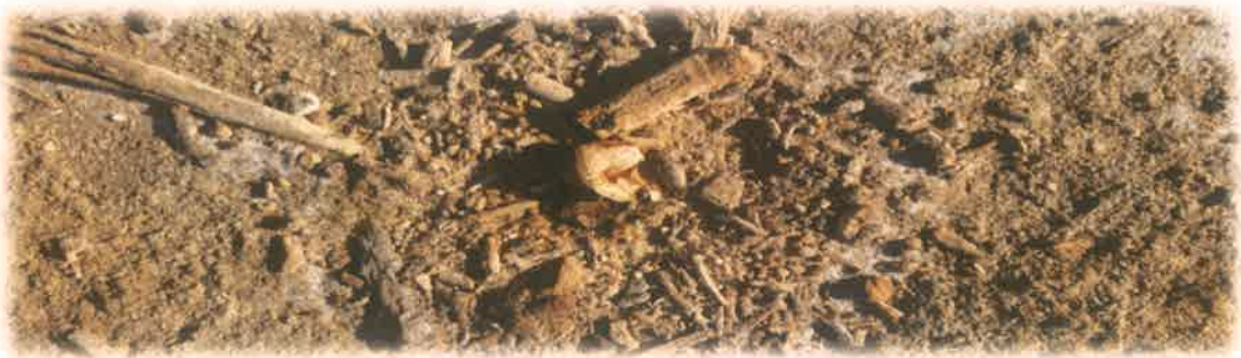
Nido pisado por la gente

A esto se suma los paseos a caballo, el uso de vehículos todos terrenos y el tráfico humano en la playa, ya que aplastan los nidos y pollos.