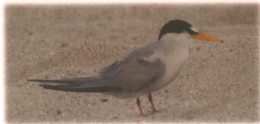
Gallito Marino ( Sternula antillarum )

Décimo Cuarto. - El Gallito Marino ( Sternula antillarum ) también denominado charrancito americano, charrán menor, charrán chico, charrán menudo, gaviotín chico boreal, gaviotín enano, gaviotín pequeño y golondrina marina menor, es una especie de ave caradriforme de la familia Sternidae, considerado el más pequeño de los charranes de Norte América, llegando a medir entre 22–24 cm de largo y con un peso entre los 39–52 g. Se reproduce principalmente en Norteamérica y migra para pasar el invierno en América Central, el Caribe y el norte de Sudamérica.