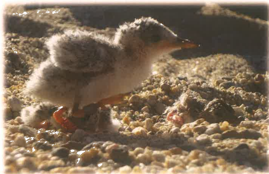
Pollo de Gallito Marino ( Sternula antillarum ) de 6 días de nacido.