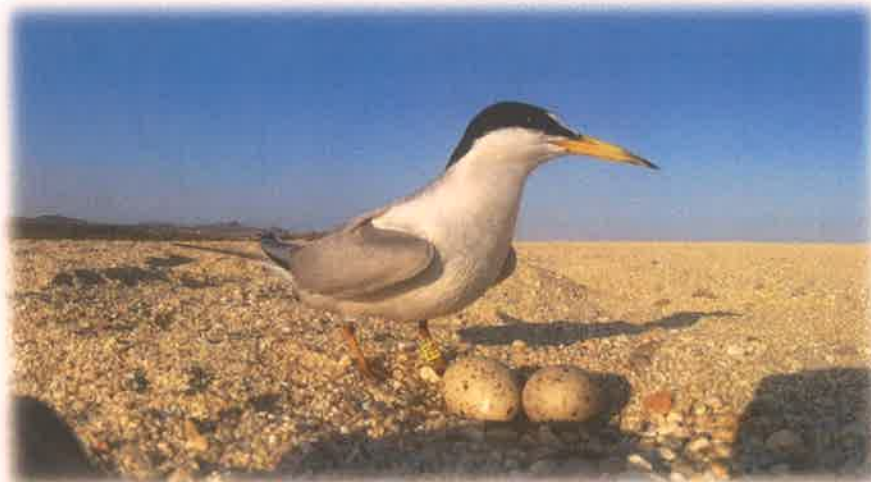
Gallito Marino ( Sternula antillarum ) y nido

Es una especie migratoria, cada año durante la primavera migra desde Centroamérica hasta las costas del noroeste de México, incluyendo la Península de Baja California, y sureste de Estados Unidos en donde se reproduce. El periodo reproductivo es entre finales de abril y hasta el mes de agosto. Generalmente anida en colonias y, a veces, en parejas aisladas. El nido está a cielo abierto y consiste en un raspado superficial, a veces cubierto con piedras, hierbas y escombros. Realizan una nidada al año, en ocasiones dos. Ponen de 1 a 3 huevos, la incubación dura un promedio de 22 días.