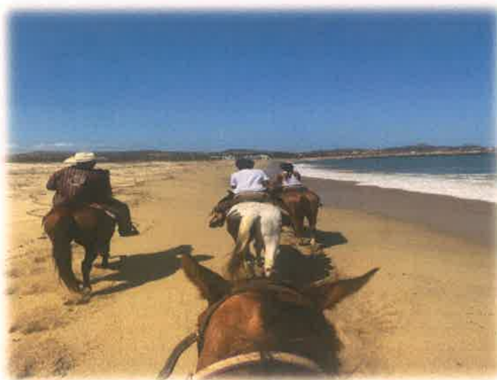
Paseo a caballo barra del Estero (Foto tomada de internet)

https://mx.mycaboexperience.com/actividades-terrestres/atv/migrino-desierto-y-playa