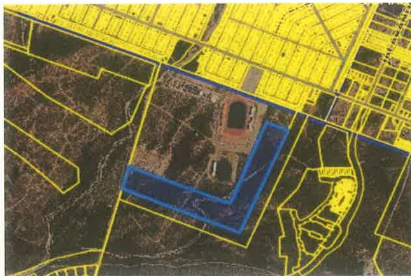
Fracción B-C de la fracción B, remanente de la fracción B, dentro del predio denominado "La Laguna", en Col. Los Cangrejos, en Cabo San Lucas, B.C.S.

IV. Que el Municipio de Los Cabos es legítimo propietario de lote de terreno identificado como fracción B-C de la fracción B, remanente de la fracción B, dentro del predio denominado "La Laguna", en Colonia Los Cangrejos, de Cabo San Lucas, B.C.S., con clave catastral 4020131143 (cuatro cero dos cero uno tres uno uno cuatro tres), con una superficie total de 103,262.08 m 2 (ciento tres mil doscientos sesenta y dos punto cero ocho metros cuadrados), que adquirió mediante contrato de donación que otorgó "Grand Armee del Cabo, S.A. de C.V.", formalizado en escritura pública número 22,984 (veintidós mil novecientos ochenta y cuatro) de fecha 17 mayo 2019, debidamente inscrita en la Dirección del Registro Público de la Propiedad y del Comercio del Municipio de Los Cabos, bajo folio real 004-49311 (cero cero cuatro guion cuatro nueve tres uno uno) de fecha 19 de junio de 2019, en cumplimiento a lo dispuesto por la Ley De Desarrollo Urbano para el Estado de Baja California Sur.