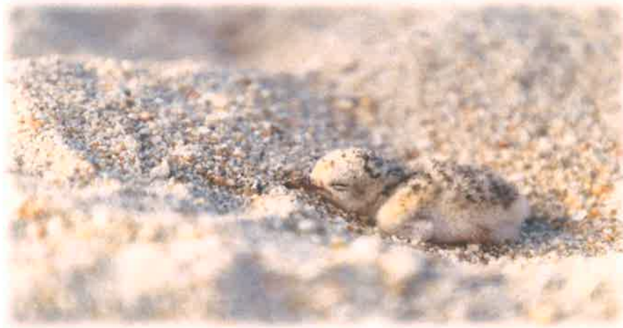
Pollo de Gallito Marino ( Sternula antillarum ) de 2 días de nacido.

Dos a tres días después de salir del huevo, los polluelos se alejan del nido para esconderse en las inmediaciones. Ambos padres alimentan a las crías las cuales comienzan a volar a los 19 o 20 días. Las crías permanecen con los padres por 2 o 3 meses más.